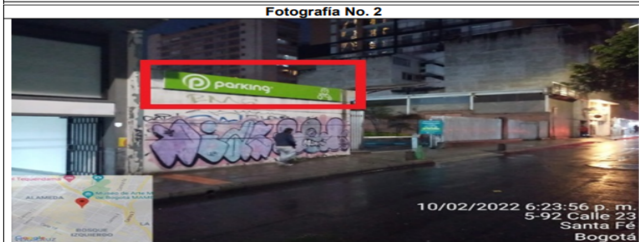
Foto No. 2 En la cual se puede evidenciar un (1) elemento tipo aviso en fachada (ubicado sobre calle23 con texto publicitario “parking + logo”, el cual no cuenta con registro ante la Secretaría Distrital de Ambiente.