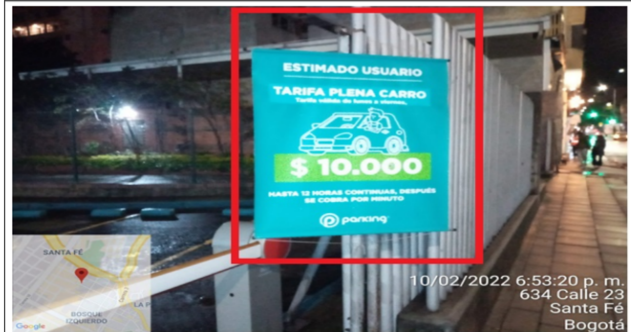
Foto No. 3 Sobre la entrada de la calle 23 al establecimiento de comercio denominado PARKING INTERNATIONAL S.A.S se evidencia un (1) elemento tipo aviso con texto publicitario "Estimado Usuario tarifa plena carro tarifa plena de lunes a viernes + imagen carro $ 10.000 hasta 12 horas continuas se cobra por minuto parking"

Nota aclaratoria: Por error en el diligenciamiento del acta de visita técnica No. 202434 del 10 de febrero del 2022 se identificó un (1) elemento como tipo pendón, el cual corresponde a un elemento tipo aviso como se relacionan en la foto No. 3 de este concepto técnico.